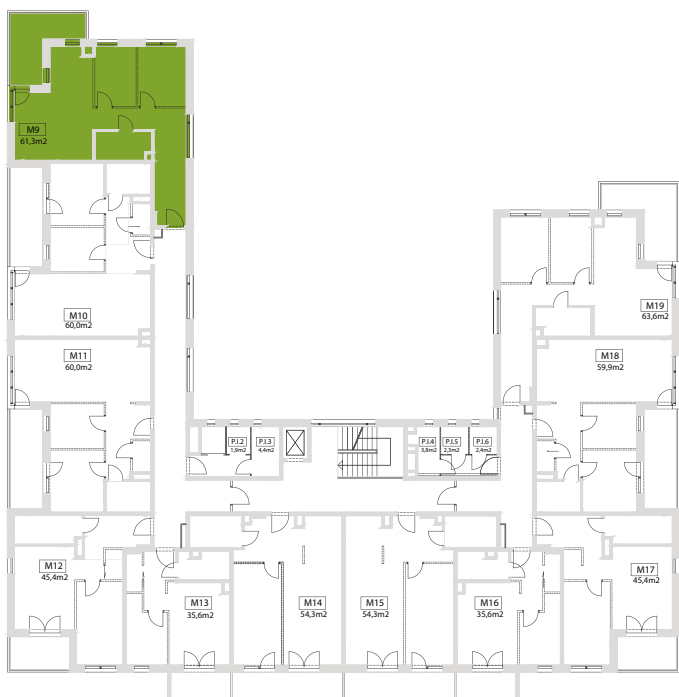
BUDYNEK C - SCHEMAT KONDYGNACJI